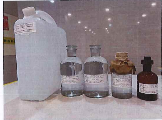
鹤山北控水务第三水厂出厂水样品