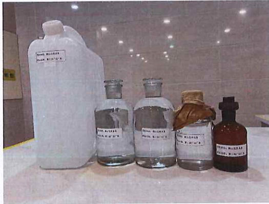
鹤山北控水务第三水厂出厂水样品