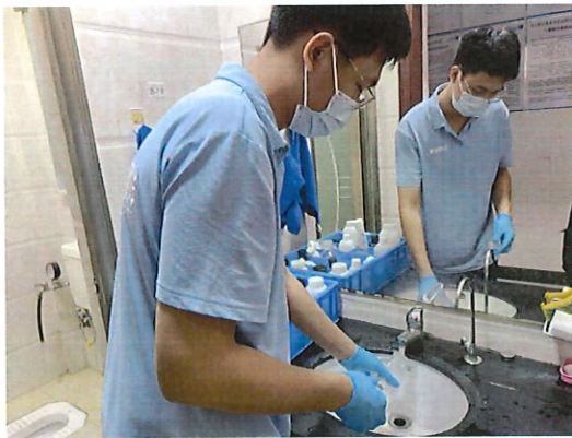
北控水务古劳营业所采样口