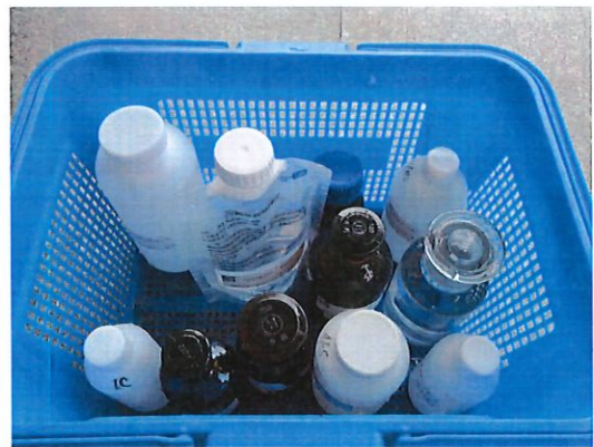
鹤城镇第一小学水样