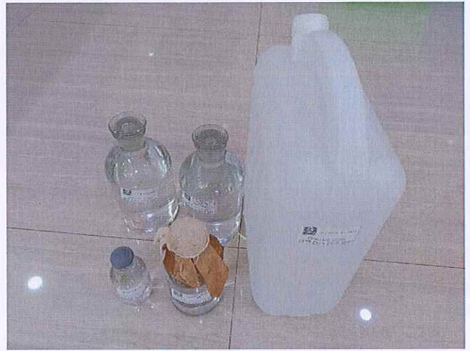
图 2：鹤山北控水务第二水厂出厂水样品